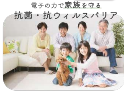
電子の力で家族を守る 抗菌・抗ウィルスバリア